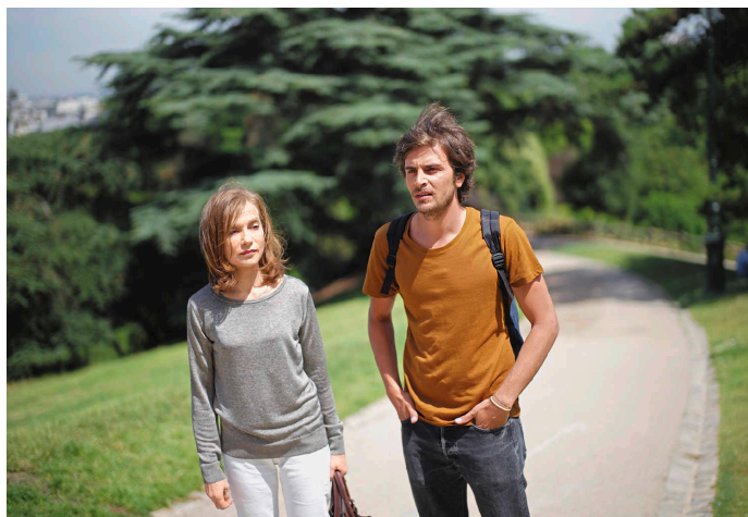
Isabelle Huppert, Roman Kolinka

Nathalie ist Lehrerin für Philosophie an einem Pariser Lycée und sehr engagiert. Nebenbei publiziert sie in einem kleinen Verlag. Ihr Mann unterrichtet an der Universität. In ihrem intellektuell-bürgerlichen Haushalt sind die beiden erwachsenen Kinder ebenso gern zu Gast wie ihre Studenten und ihre besitzergreifende Mutter. Um die Zukunft hat sich Nathalie in ihrem ausgefüllten Alltag bisher kaum Gedanken gemacht. Doch eines Tages offenbart ihr ihr Ehemann, dass er sie für eine andere Frau verlassen wird. Mit einer plötzlichen Freiheit konfrontiert, die jedoch auch Einsamkeit mit sich bringt, muss Nathalie sich selbst und ihr Leben neu erfinden. Mit ihrem fünften Spielfilm verlässt Mia Hansen-Løve das Thema Jugend und reflektiert in einem intensiven, auch ironischen Frauenporträt über das beginnende Altern. Es geht um Fragen des Glücks, der Berufung, des Sinns oder Unsinn gefestigter Strukturen. Dabei zeigt der Film nicht nur die persönliche Suche nach neuen Wegen, sondern fragt auch, ob und wie Philosophie auf den Alltag angewandt werden kann.