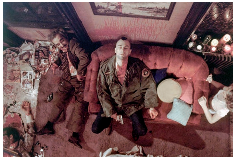
Robert De Niro