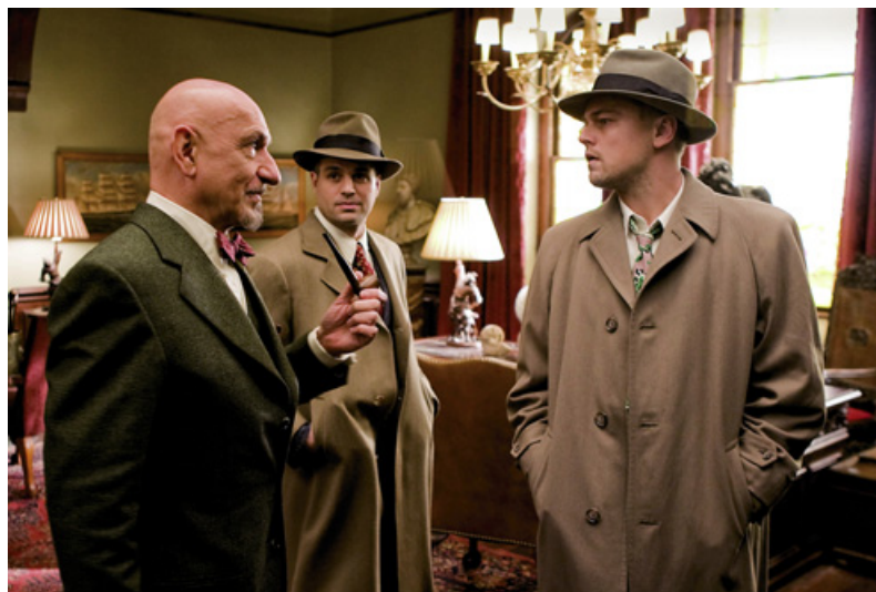
Ben Kingsley, Mark Ruffalo, Leonardo DiCaprio

Weltvertrieb Paramount Vantage 5555 Melrose Avenue USA-Hollywood, CA 90038 Tel.: +1 323 9562000 Fax: +1 323 8622153 sales@paramountvantage.com